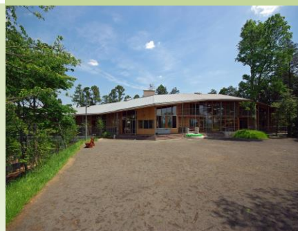
希望の丘に立つ初等学校の学舎